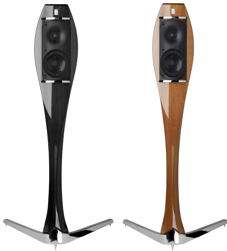
Medium gloss graphite